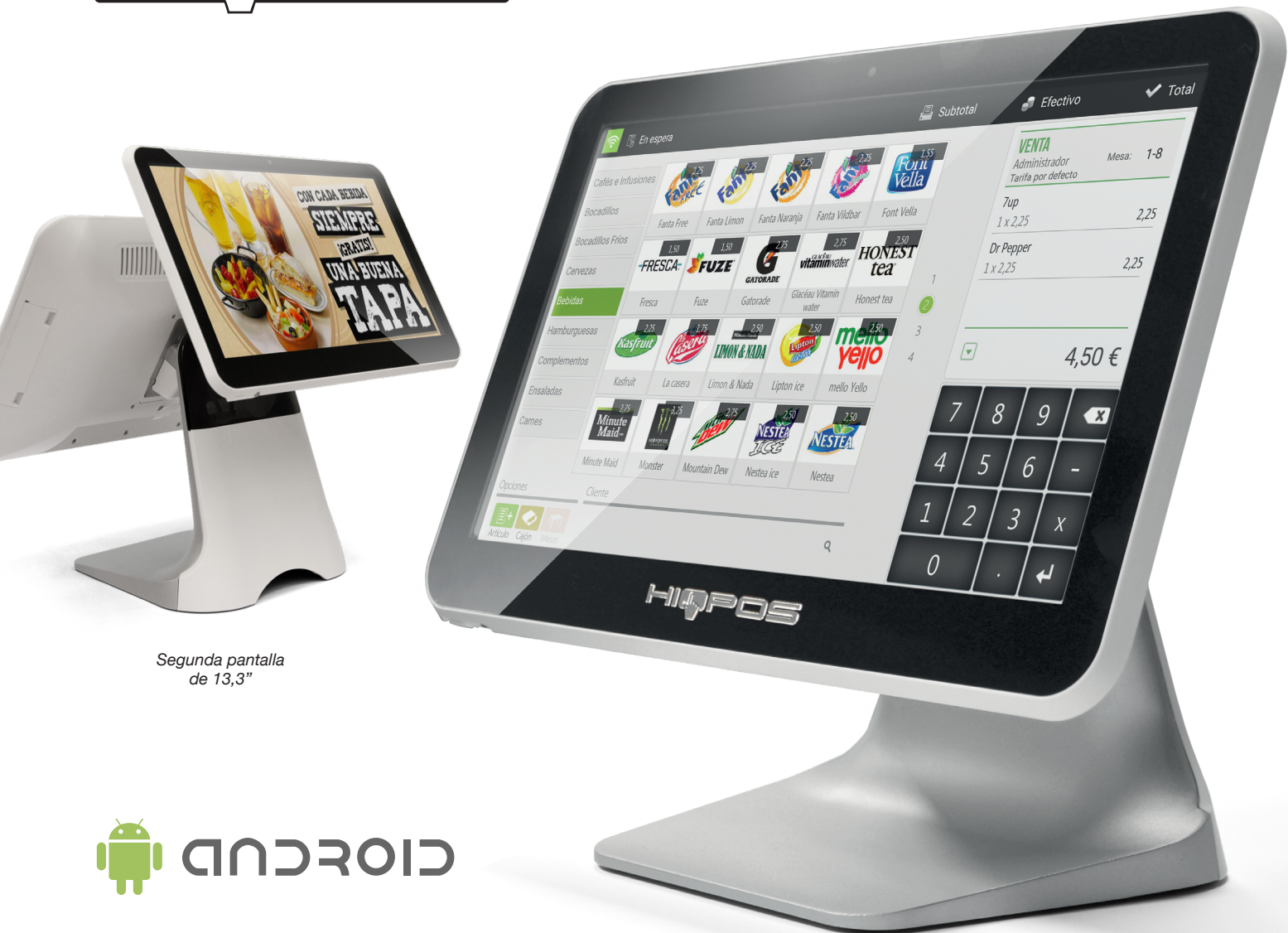
Segunda pantalla de 13,3"